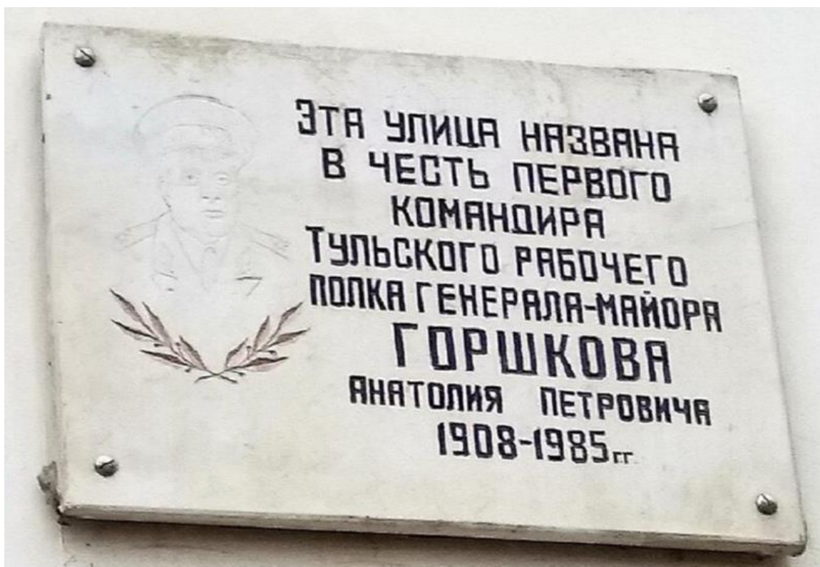
Мемориальная доска, установленная на доме 26 по улице Генерала Горшкова