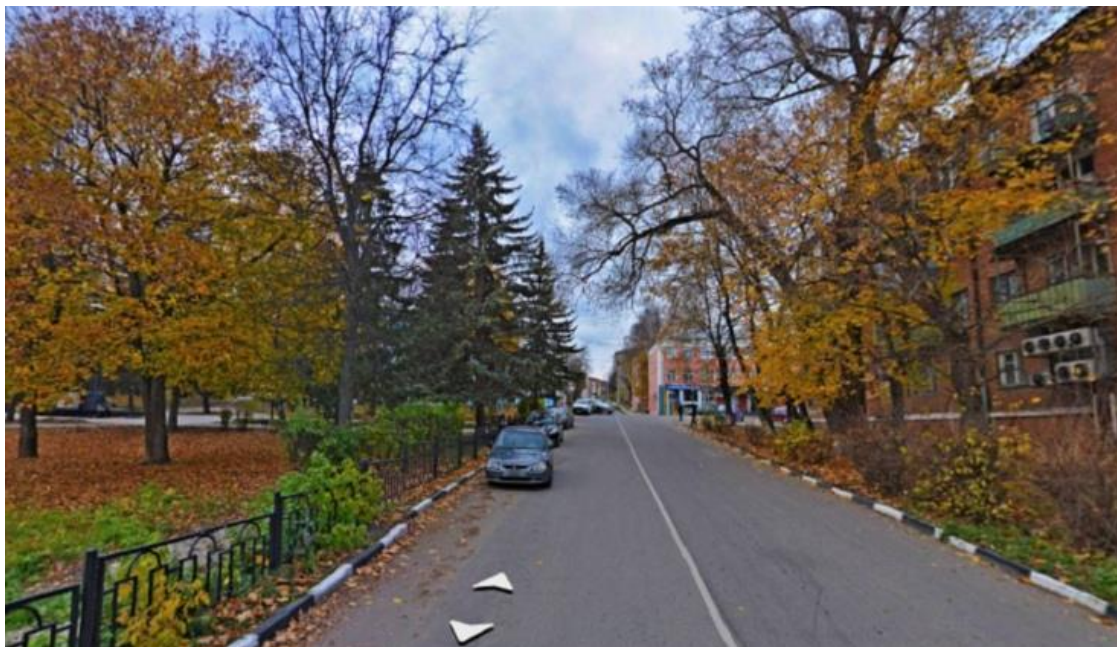
Улица Генерала Горшкова в Туле

В память об этом замечательном человеке названа улица Генерала Горшкова, расположенная в поселке Косая Гора на юге Привокзального городского округа Тулы (бывшая Стадионная).